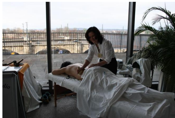
Produktpräsentation am Ausstellungsstand