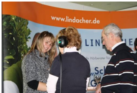
direkter Kontakt zu den Besuchern