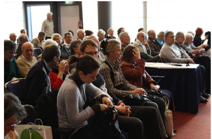
Vortrag in der Seminarebene

Weitere Bilder sowie die Nachberichte der vergangenen Veranstaltungen finden Sie unter: www.vita-grande.de/galerie