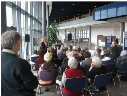
Vortrag auf dem Messepodium

Weitere Bilder sowie die Nachberichte der vergangenen Veranstaltungen finden Sie unter: www.vita-grande.de/galerie