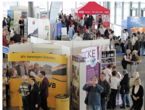
Terrassenfoyer des internationalen Kongresszentrums